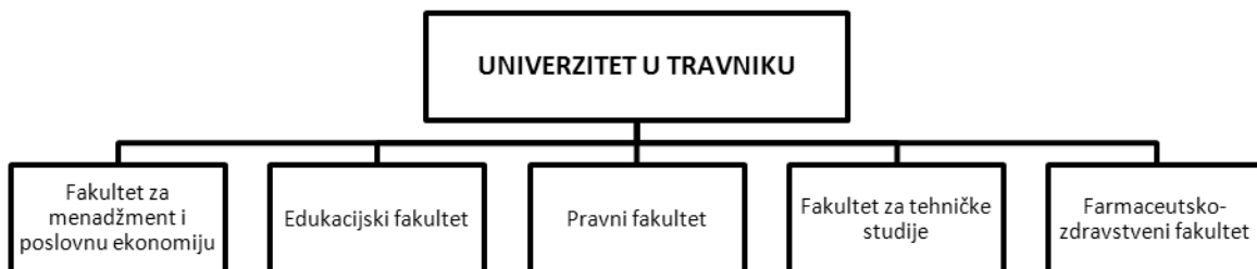
Slika 1. Prikaz organizacijskih jedinica Univerziteta u Travniku

Univerzitet u Travniku, menadžment Univerziteta i sve njegove sastavnice maksimalno afirmativno prilaze spomenutim prvcima razvoja, uz saznanje da su univerziteti danas, kako u BiH, jednako tako i u cijeloj Evropi, primarno orijentisani na transfer znanja i tehnologija prema ciljanim društvenim grupama, poslovnim subjektima ili općenito na akumulaciju znanja i prijenos tih znanja novim generacijama. U tom kontekstu, UNT svakako jestegenerator selekcije određenih u društvu aktueliziranih i atraktivnih studijskih programa za koje je vrlo vjerovatno da kapacitete finalne produkcije može realno i relativno lahko, apsorbirati tržište rada.